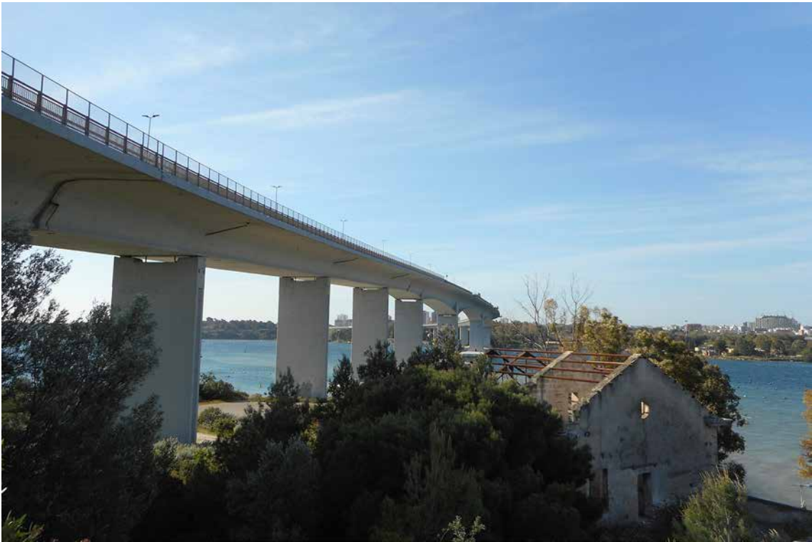
Die 1977 errichtete „Ponte Punta Penna Pizzone di Taranto“ gilt als eine der längsten Spannbetonbrücke Europas.