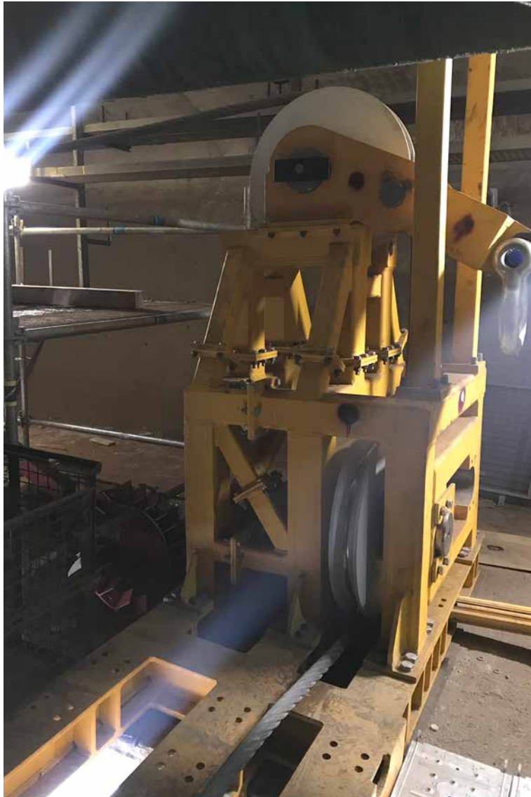
90°-Umlenkungen des Windenseils im Brückeninneren.