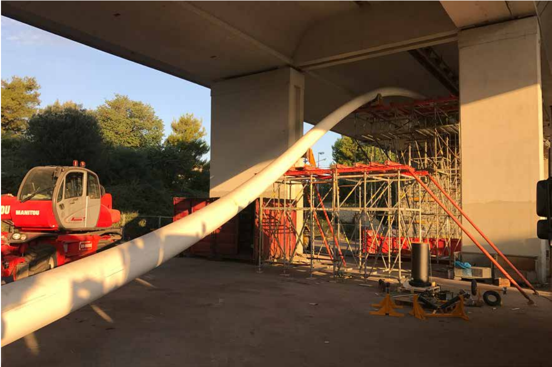
Zwischenpodeste mit Rollenblöcken zum Anheben des Rohrstrangs auf Höhe des Rig-Arbeitspodestes.